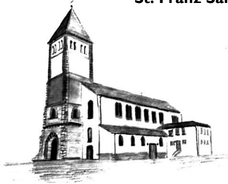
St. Mariä Himmelfahrt