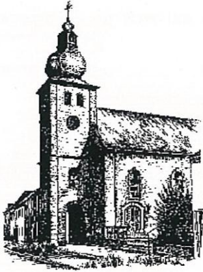
St. Philippus und Jakobus